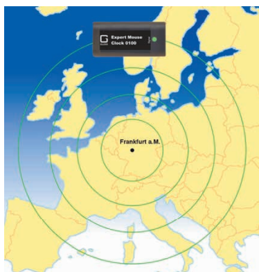
Abb. 2: Ausbreitung des DCF77-Signals

den Anschluss des Gerätes. Unregelmäßiges Blinken deutet auf schlechten Empfang bzw. eine Störung von außen hin. Ursache dafür können zum Beispiel Monitore oder andere elektronische Geräte sein. Suchen Sie in solchen Fällen eine bessere Empfangsposition. Auch durch Drehen der Expert Mouse Clock kann der Empfang verbessert werden (vgl. Abb. 2). Wenn Sie eine gute Empfangsposition gefunden haben, fixieren Sie die Expert Mouse Clock . Nach zwei bis drei Minuten wird die PC-Uhr synchronisiert.