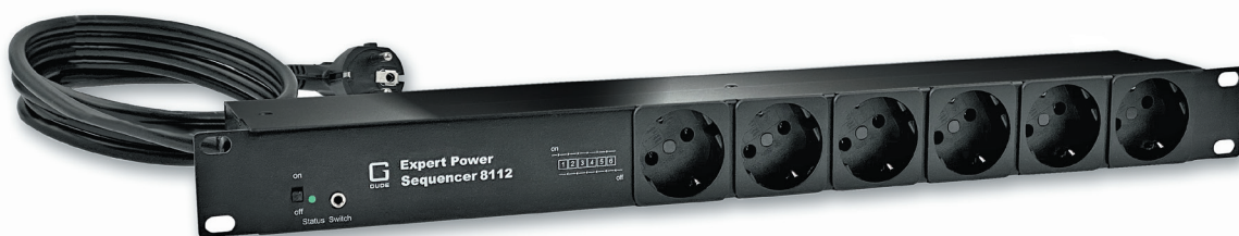
Expert Power Sequencer 8112-4 mit 6 Schutzkontakt-Anschlüssen auf der Frontseite