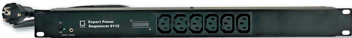
Expert Power Sequencer 8112-2 mit 6 IEC C13-Anschlüssen auf der Frontseite

Der Expert Power Sequencer 8112 kommt beispielsweise in AV-Installationen mit einer Endstufe zum Einsatz. Der dort verwendete Audioverstärker wird am letzten Lastausgang angeschlossen. Die PDU sorgt nun dafür, dass der Verstärker nach den anderen Komponenten als letztes eingeschaltet wird. Beim Ausschalten in umgekehrter Reihenfolge wird er vor den anderen Komponenten als erstes geschaltet. Die andernfalls auftretenden Knallgeräusche, die nicht nur unangenehm sein können, sondern auch Lautsprecher und Verstärker schädigen können, gehören damit der Vergangenheit an.