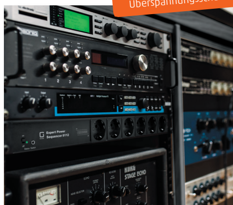
Betreiber von Audio-Racks profitieren von der Schaltsequenz des Expert Power Sequencer 8112

Mit integriertem Netzfilter und Überspannungsschutz Typ 3